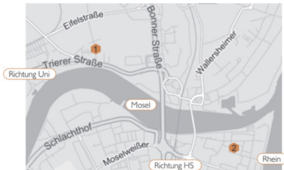
1 - Bude; 2- Altstadt